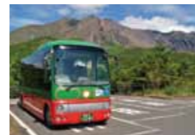
樱岛 Island View

从樱岛出发，尽享众多自然风光及旅游景点。中途在巴士停车时下车的人士适合购买一日乘车券。